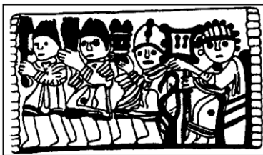
Lestans, Loc. S:Zenone Placchetta in bronzo con Erode ed I Re magi IX sec. d.C. Disegno F.Serafini

Sono esposti numerosi reperti provenienti dai castelli di Toppo, Pinzano e Solimbergo, nonché reperti ceramici rinascimentali da uno scavo archeologico di una discarica di una fornace rinascimentale di Castelnovo del Friuli loc. Cruz