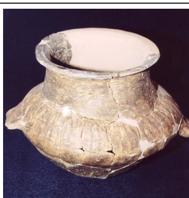
Sequals loc. Cunizei Olla X sec. a.C.

Reperti litici del mesolitico provengono dal “Pra Feletta” e Valinis di Meduno, e dall’Ancona della Santissima di Travesio