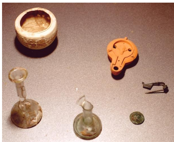
Lestans, Necropoli di Via dei Tigli Corredo tomba II sec. d.C.

Da Meduno, loc. Ciago sono esposti i reperti rinvenuti dallo scavo di una villa romana (III-IV sec. d. C.) tra i quali spicca un'interessante fibula di un guerriero a cavallo, una lucerna e alcune campanelle in bronzo.