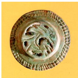
Castello di Solimbergo Fibula di Köttlach X-XI sec.