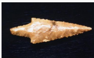
Pinzano Loc. Pontaiba Punta di freccia (Eneolitico)