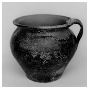
Castello di Solimbergo Olla XV sec.